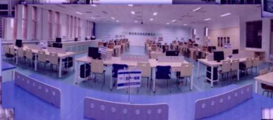
商贸管理类专业 综合训练场所